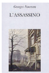
L'assassino Georges Simenon Adelphi 153 pagine €16