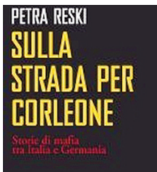
La Reski analizza la dimensione europea della mafia

Con «Sulla strada per Corleone» la reporter tedesca ricostruisce legami affiliati e «successi» delle organizzazioni mafiose italiane in Germania