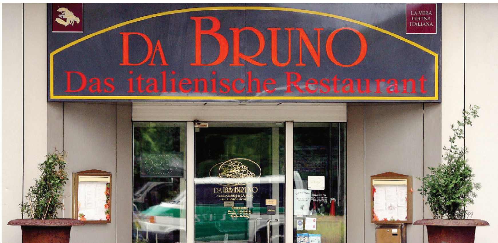
Duisburg: il ristorante davanti al quale è avvenuta la strage di cui parla il libro di Petra Reski